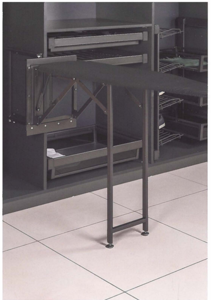
Des équipements supplémentaires intégrés peuvent améliorer la fonctionnalité des vestiaires

nécessairement des solutions sur mesure. Par exemple, il existe de nombreux systèmes modulaires et flexibles qui peuvent être utilisés pour aménager les parois du vestiaire. Ainsi, les espaces aux dimensions bizarres ou les toits en pente ne doivent pas signifier une personnalisation immédiate pour le client. Il existe d'innombrables options et solutions pour toutes les situations imaginables, il y a même des systèmes avec des joints à rotule pour que le dressing puisse s'ajuster sans problème aux plafonds inclinés. Les systèmes, qui sont constitués de profilés en aluminium ou en plastique, peuvent être facilement découpés sur mesure pour s'adapter parfaitement à la pièce.