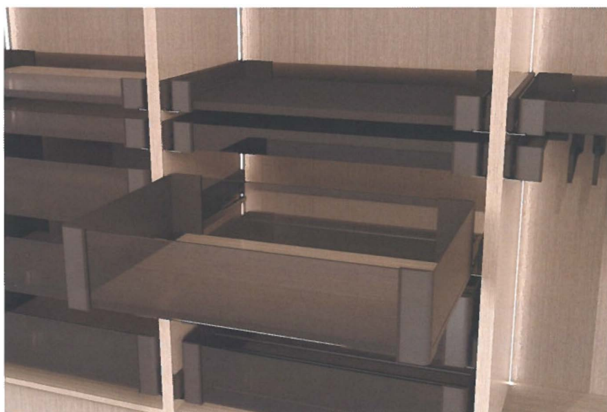
Les styles de finition, l'utilisation des matériaux et les dimensions des tiroirs de rangement sont tous personnalisables

Cette grande liberté permet de personnaliser complètement les tiroirs en fonction des goûts personnels. Mais le design Conero profite également à l'espace de rangement. En effet, ces solutions innovantes assurent un gain d'espace efficace, permettant d'exploiter réellement chaque centimètre de l'armoire.