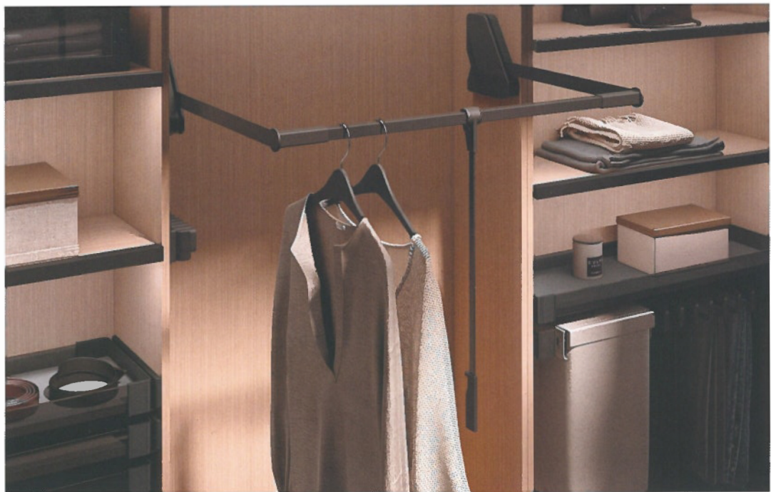
Le levier et la cinématique brevetés de l'élévateur assurent une manipulation accessible et sans effort