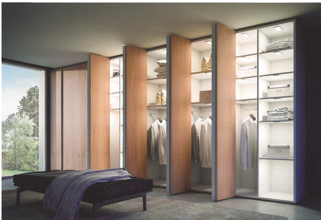
L'éclairage intégré est un atout qui en vaut vraiment la peine

les clients peuvent facilement trouver leurs chaussures. Le simple fait de les ranger sur une étagère prend beaucoup de place mais manque également de cette vue d'ensemble qui rend le dressing si pratique. Il existe différentes options pour satisfaire le client, telles que: des étagères coulissantes, des étagères fixées à l'intérieur d'une porte ou des supports spéciaux que l'on peut placer dans un tiroir ... Il existe de nombreuses options différentes, mais le plus important est que les chaussures soient faciles à entrer et à sortir de l'armoire et que la profondeur de l'armoire soit utilisée de manière optimale.