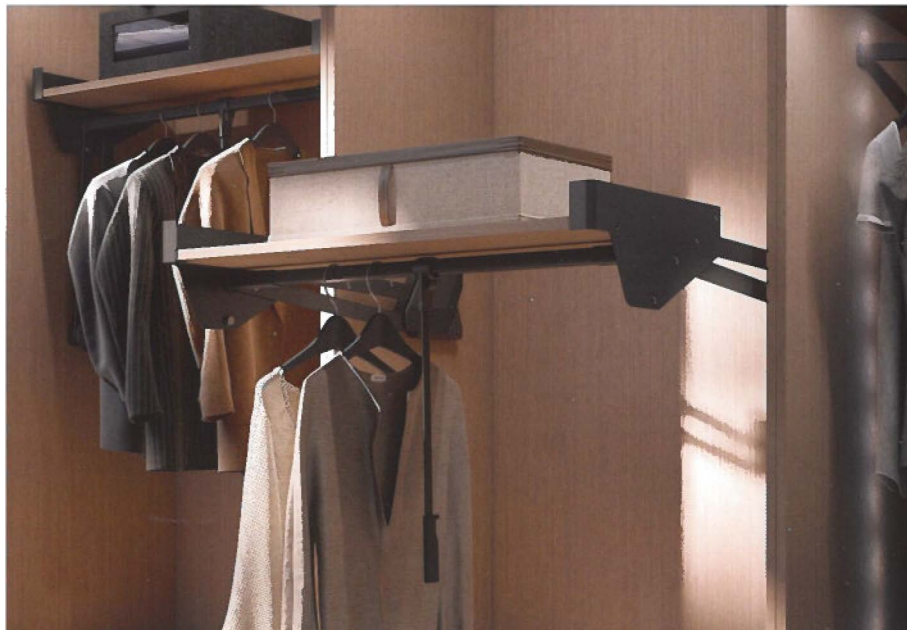
Une nouvelle innovation est un élévateur de penderie avec une étagère intégrée

permettent de garder les pantalons des clients joliment dans le pli.