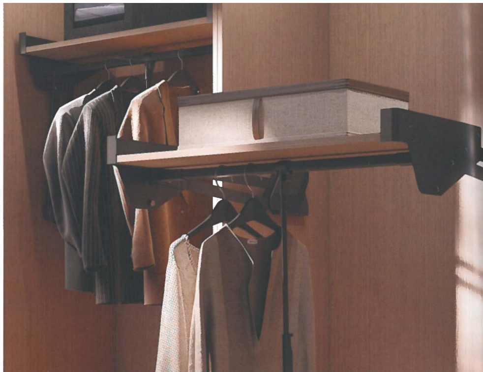
Le système Conero se caractérise par sa flexibilité, son élégance et sa facilité d'utilisation

Van Opstal complète son assortiment avec la nouvelle gamme Conero de Kesseböhmer. En effet, le fabricant de tous les types d'aménagements d'armoire, est fier de présenter une nouvelle gamme de dressing: le système Conero. Cette solution d'aménagement d'armoire offre flexibilité, élégance et facilité d'utilisation. Elle s'intègre donc parfaitement dans la gamme de haute qualité de Van Opstal.