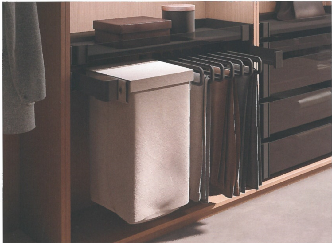
Il existe une solution de rangement pour chaque vêtement possible

l'élévateur accessible et pratiquement sans effort. De plus, cette expérience sans faille est garantie sur tout le trajet de l'élévateur. En outre, en première mondiale, Conero offre pour la première fois un élévateur à vêtements avec une planche de rangement supplémentaire par-dessus. Cela garantit une utilisation efficace de l'espace.