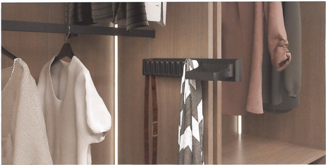
Pour gagner de la place, les cravates, les ceintures et les boutons de manchette peuvent être rangés dans un support combiné