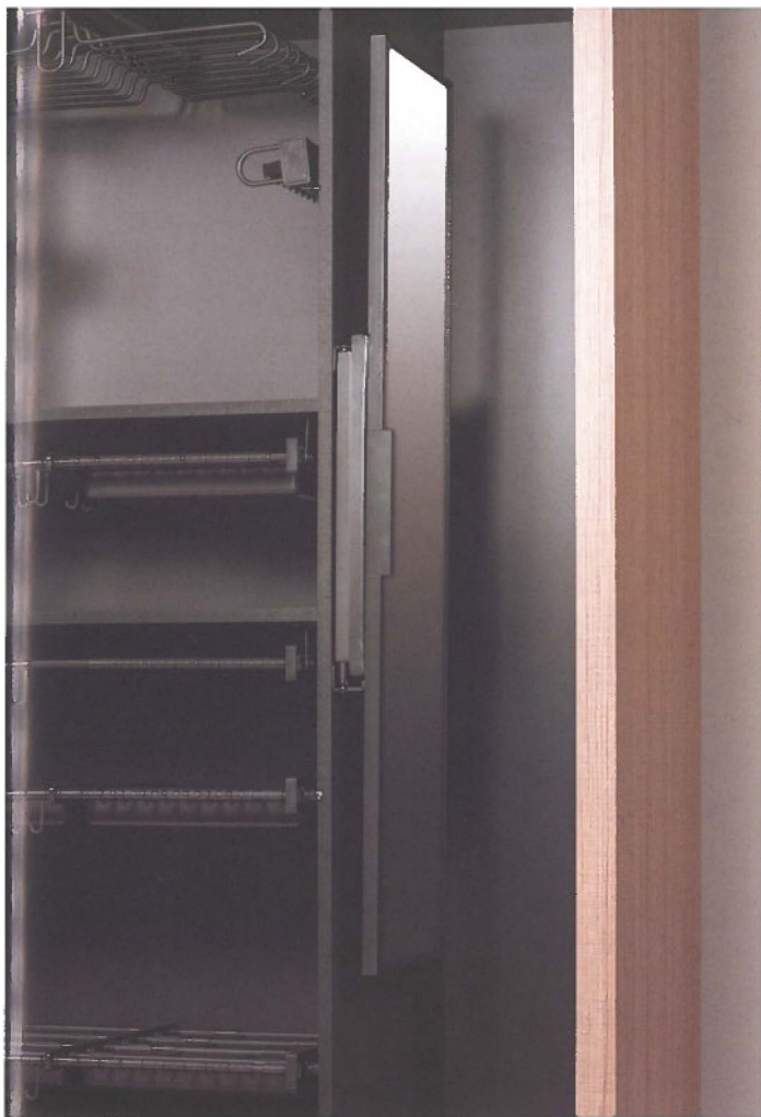
Un miroir ne doit évidemment pas manquer, mais il existe des solutions de rangement pratiques pour cela aussi