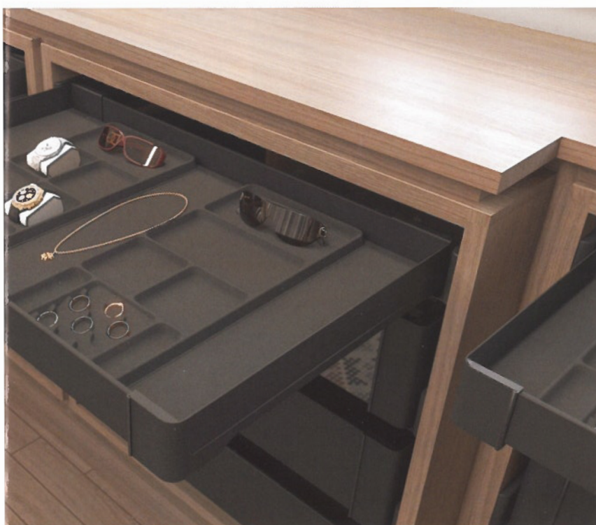
Un tiroir peu profond avec compartimentage est parfait pour ranger les bijoux

Contrairement à ce que beaucoup de gens pensent, tous les dressings ne sont pas